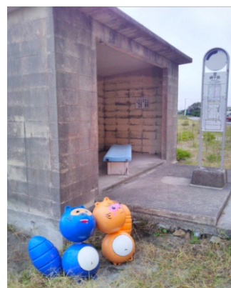
網干島バス停に置かれたタヌキ↑

*コース上には、漁業用のブイで作られたホテルのキャラクター・リゾットファミリーと大毛島タヌキの置物が設置され、おへその文字をつなげるとメッセージが完成するスタンプラリーも楽しめます。