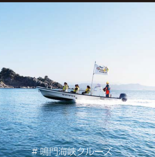
# 鳴門海峡クルーズ